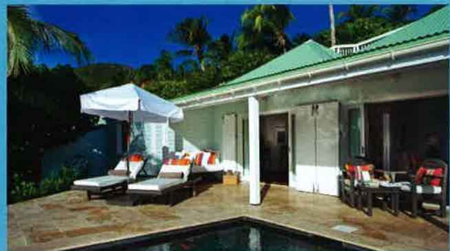
L'HÔTEL LE TOINY

L es habitants de Saint-Barthélemy, le savent: c'est de ce côté-ci de l'île, sur la côte sauvage, que se contemplant les couchers de soleil. Niché sur les hauteurs d'un parc de 17 hectares, ce 5 étoiles est l'évident repaire des amoureux de la nature, avides de farniente. De plus, la présence du renommé chef français, Stéphane Mazières, fait de ce Relais & Châteaux une des meilleures tables de Saint-Barth. Anse de Toiny, 97133, Saint-Barthélemy Tél. 00 590 590 27 88 88, www.letoiny.com