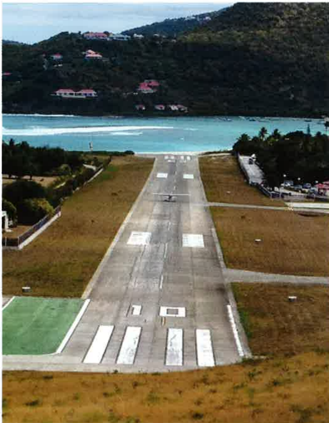
ICI, PAS DE LONG-COURRIERS. LA PISTE EST TROP PETITE