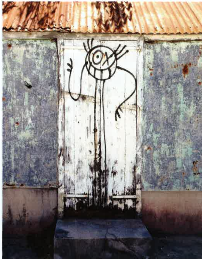
UN GARAGE ABANDONNÉ À GRAND FOND