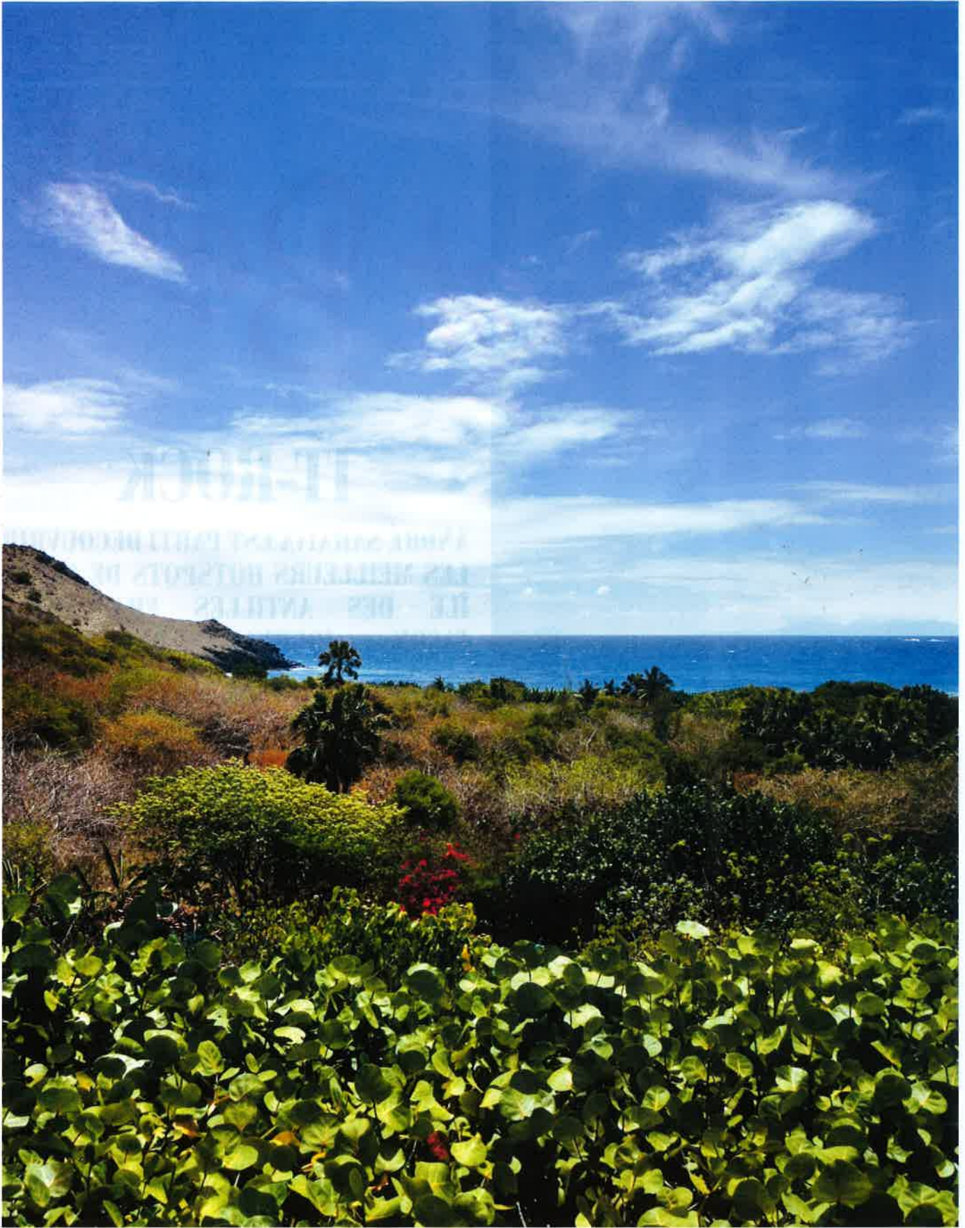
LA CÔTE SAUVAGE VUE DE L'HÔTEL LE TOINY