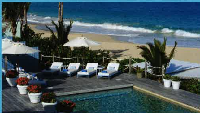
L'HÔTEL L'ISLE DE FRANCE

S itué sur la plus belle plage de l'île, la baie des Flamands, ce 5 étoiles n'est que paix, de luxe et de beauté. Chambres, suites, bungalows et même villas – dont deux de plus de 400 m 2 avec home ciné et piscine à débordement – y sont proposés. On pourrait parler de son spa et de son restaurant, mais le mieux est encore de siroter une Carib, la bière locale, au Select, le bar "canaille" de l'hôtel. Baie de Flamands, PB 612, 97133, Saint-Barthélemy Tél. 00 590 590 27 61 81, www.isle-de-france.com