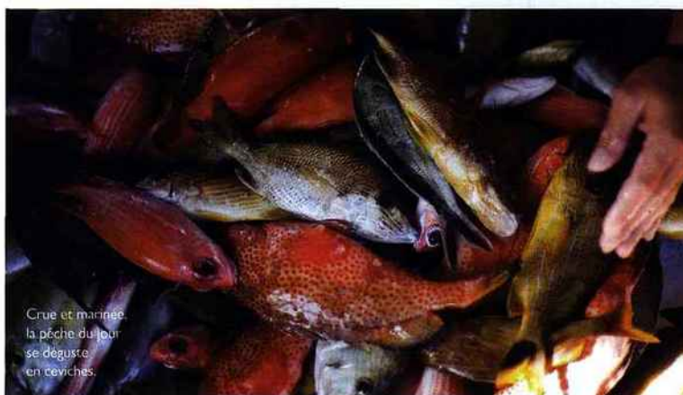
Crue et marinée, la pêche du jour se déguste en ceviches.